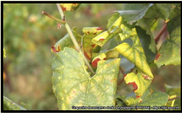
Detailnejší pohľad na žltnutie a stočenie listu viniča

Lokalizovať zlaté žltnutie viniča možno v cievných zväzkoch napadnutého viniča odkiaľ je prijímané vektormi pre ďalší prenos. Jediný infikovaný exemplár môže stačiť na prenos ochorenia a na začiatok nákazy. Fytoplazma bola nájdená v slinných žľazách infikovaného hmyzu (vektora) a sérologicky detegovaná v jednotlivých exemplároch.