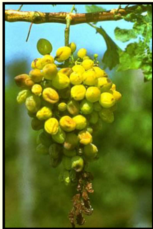
Príznaky pokročilej infekcie strapca hrozna so scvrknutými, miestami hnedými bobuľami