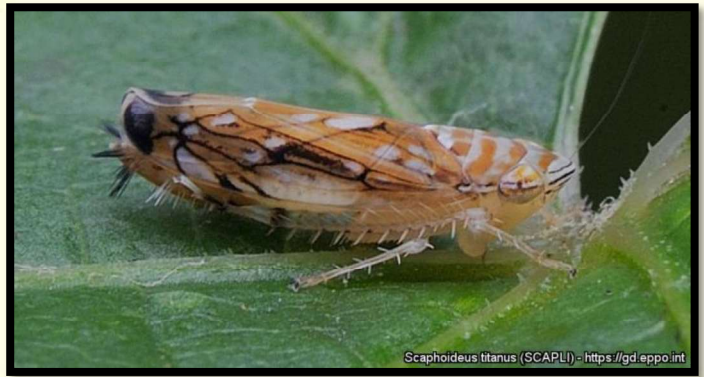
Scaphoideus titanus (cikádka viničová)