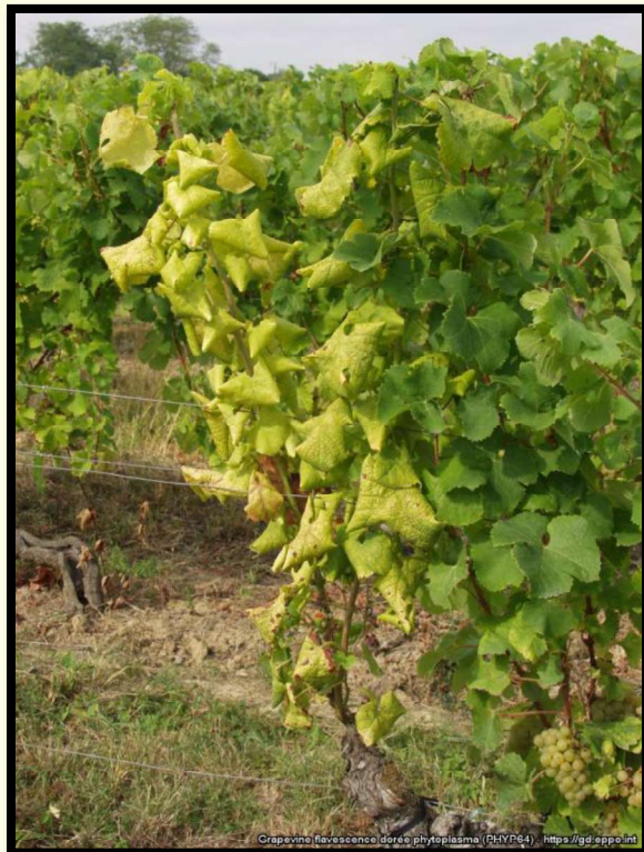
Žltnutie a stáčanie listov viniča