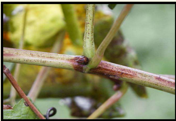
Príznak napadnutia na viniči (čierne pľuzgieriky)