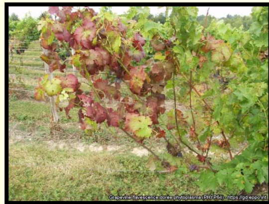
Príznak napadnutia na viniči (sčervenanie listov)